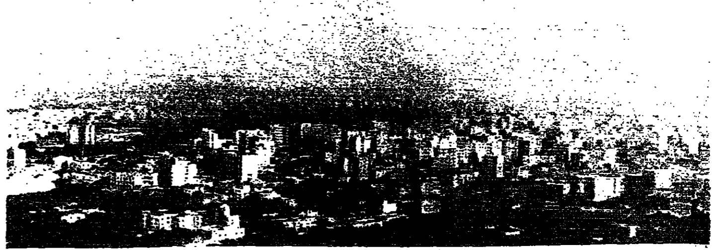
منذ عام المنطة التي شهدت الاشتباكات طوال يومين، المنطة من قبل الزعرير والكوكبة (من اليسار) حتى من قبل وجسر الماشا، وبنو

التي بعد منتصف ليل امس الاول، وقد نفذت اشتباكات مدفعية في مناطق الرمز - الكوكبة - من قبل الجيش - جسر الماشا - الذمة - الشياح - الرمانة بالاضافة الى جميع مياه بيروت - ويبلغ القواصق يتران مع انواع نيران الصواريخ والذمة من قبل الجيش - امس -